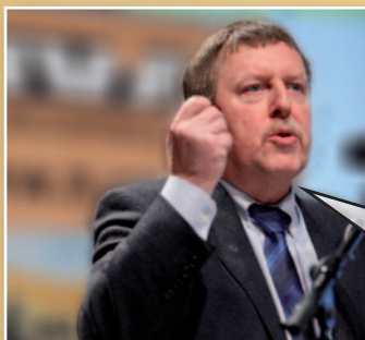
Siegfried Bracke N-VA-Kamerlid

“Het is goed in 't eigen hart te kijken”