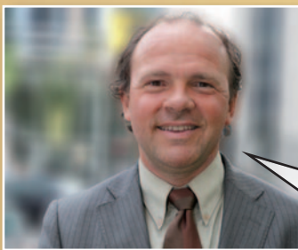
Philippe Muyters Vlaams minister van Financiën en Begroting

“Wie fouten maakte, wordt met rust gelaten”