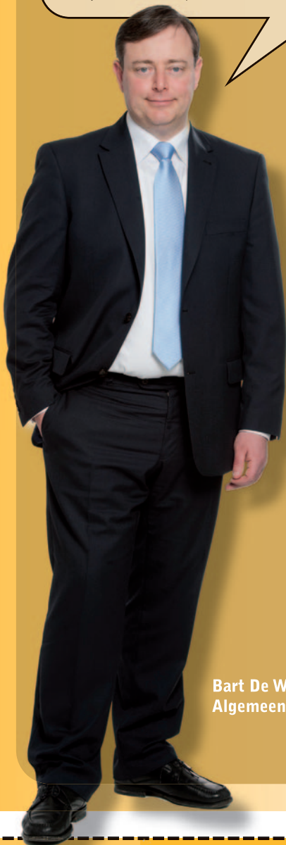
Bart De Wever Algemeen voorzitter N-VA

De N-VA kiest resoluut voor verandering. En ik vraag ook u om, samen met ons, die keuze te maken. Wil u de regering-Di Rupo weg, stem dan op 14 oktober op de N-VA!