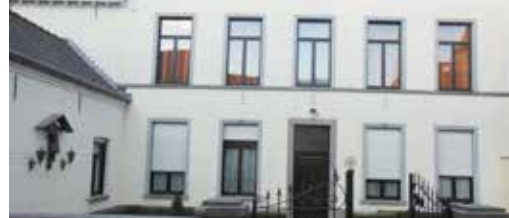
Nieuw gemeentehuis (p. 3)