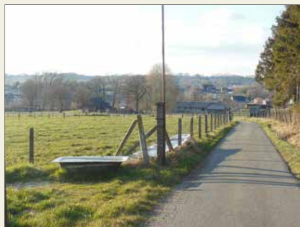
▲ Wordt dit stukje groen binnenkort ingepalmd door een sociale woonwijk? Niet als het van de N-VA afhangt.

Onze sociale woningen moeten kunnen dienen voor Brakelaars die het moeilijker hebben, zodat zij de kans krijgen om in onze gemeente te blijven wonen en werken,