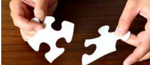
Brakelaars dupe van gemeentefusie (p. 2)